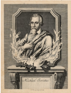
Johann Martin Bernigeroth: Bildnis des Michael Servet, 1748

UB Frankfurt, Porträtsammlung Holzhausen